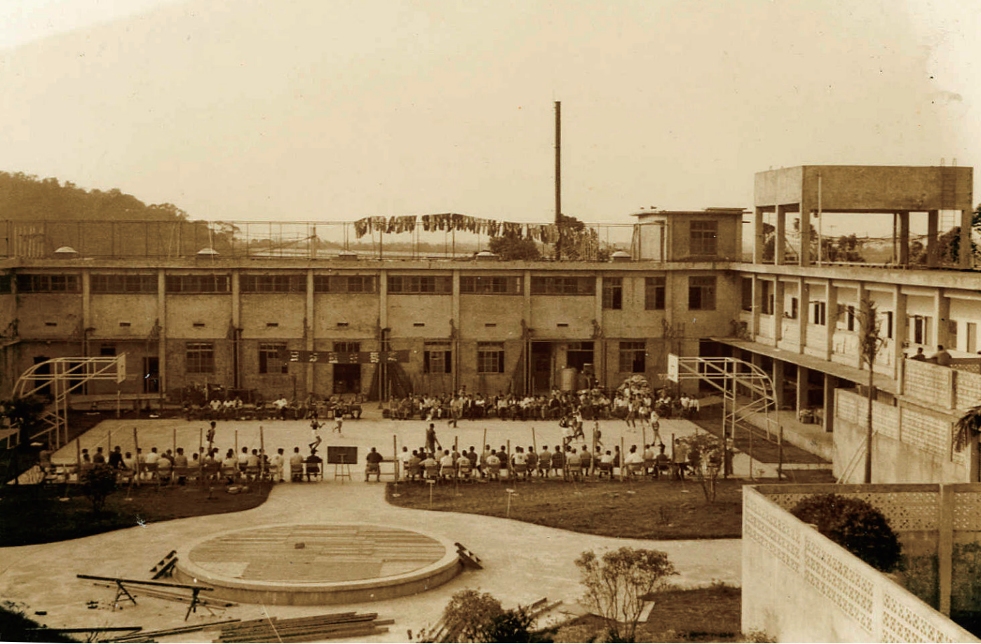
警總軍法處時期押房一隅